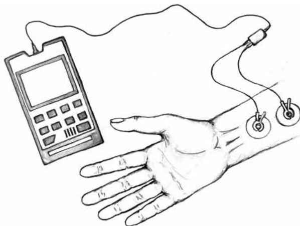
Рис. 1. Схема установки электродов для электростимуляции срединного нерва

После рандомизации, выполненной с помощью генератора случайных чисел ( www.random.org ), пациенты распределены на две группы по 20 человек в каждой. В исследуемой группе в течение операции (после индукции анестезии и до отключения анестетика) проводили чрескожную электрическую стимуляцию срединного нерва на запястье доминантной руки пациента с помощью аппарата TOF-WatchSX™ (Organon, Ирландия) единичными стимулами с частотой 1 Гц и силой тока 50 мА (рис. 1). Ток подавали через стандартные электроды, используемые для интраоперационной оценки нейромышечной проводимости. Электроды располагались на внутренней поверхности предплечья между сухожилиями мышц palmaris longus и flexor carpi radialis на расстоянии примерно 5 и 8 см от проксимальной передней складки запястья. В группе контроля вышеописанный прибор с электродами также устанавливали, но стимуляцию не производили. В обеих группах пациентам проводили стандартную индукцию на основе пропофола (2 мг/кг) и фентанила (200 мкг), миорелаксацию для интубации трахеи обеспечивали рокуронием (50 мг). Поддержание анестезии осуществляли с помощью инфузии пропофола (4–5 мг · кг -1 · ч -1 ) и болюсного введения фентанила при гемодинамических признаках недостаточности анальгезии. Повторное введение миорелаксантов не осуществ-